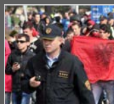
Протести во Скопје