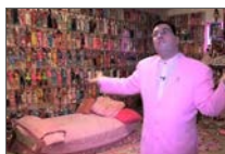
Маж кој има три илјади Барбики (видео)