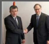
Вице-премиерот Муса Џафери во Брисел