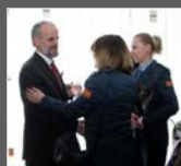
Свеченост по повод 8 Март