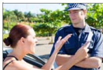
На полицајци сакала да им избега со детско автомобилче