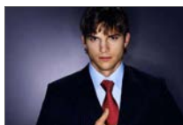
Деми Мур конечно побара развод од Качер