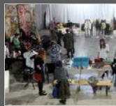
8ми Март - Прво па женско