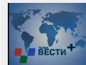
Вести плус: Финансирање на кампањи