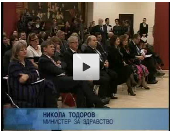
НИКОЛА ТОДОРОВ МИНИСТЕР ЗА ЗДРАВСТВО