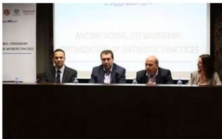
Значително намален бројот на пропишани дози антибиотици

Мониторинг | вторник, 20 јуни 2015, 13:00