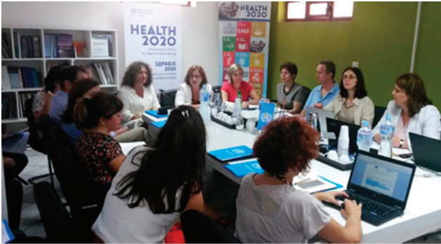
Првиот состанок на ЦТРГ за ЦОР 3+ во просториите на НК на СЗО.